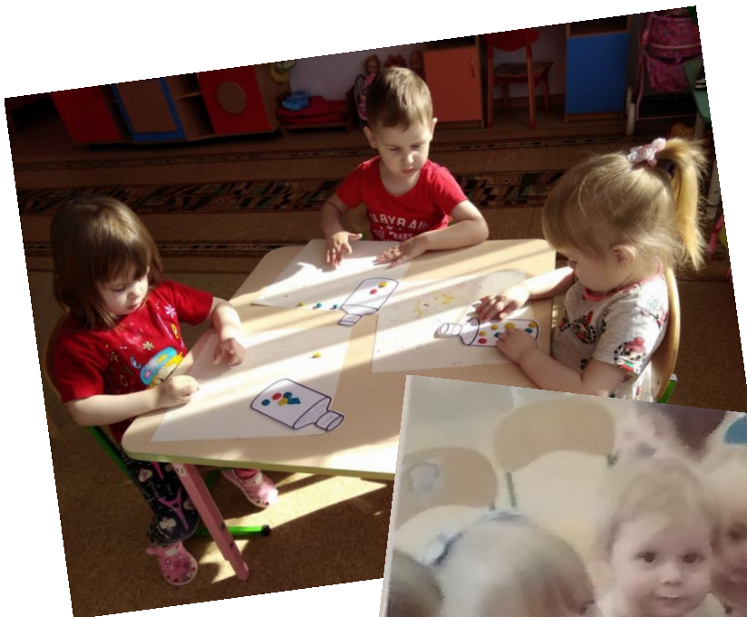
Лепили «Витамины в баночках» и играли с водичкой на занятиях.